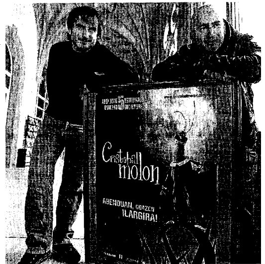
'Cristobal Molón', una de las producciones vascas más exitosas.

La difusión representa el 21,42% del volumen total de negocio, el soporte el 5,75% y la distribución el 4,56%.