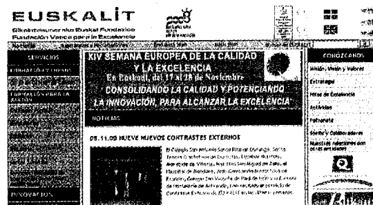
IMAGEN DE LA PÁGINA WEB DE EUSKALIT: WWW.EUSKALIT.NET

La Semana Europea de la Calidad se celebra anualmente en toda la Comunidad Europea con el propósito de compartir experiencias y mostrar lo que para las organizaciones significa la Calidad y la Excelencia en la Gestión. En el País Vasco Euskalit será un año más la entidad coordinadora